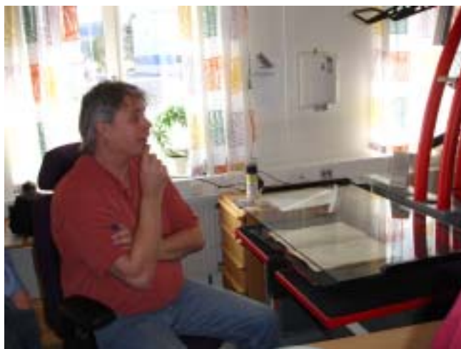
Olika skannrar på MKC, Fränsta

ferens för oss förtroendevalda. Jag hade aldrig varit i Sundsvall tidigare, så själva trakten var en intressant upplevelse. Staden har vuxit fram djupt nere i en dalgång där Ljungan rinner ut i Bottenhavet. Efter lördagens kvällsmåltid uppe på Norra berget invid staden var vi några vänner som tillsammans vandrade neråt till hotellet. Aprilkvällen var kylig och blåsig, men vilken vy med stadens ljus vi hade nedanför oss på vandringen!